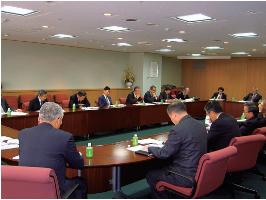
第4回理事会 (3月8日開催)