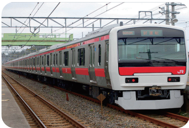
営業運転が開始された【E331系】

京葉線で新型車両 E331系営業運転開始！ 次世代の通勤電車を目指して開発された新型車両E331系が、3月18日(日)のダイヤ改正から京葉線東京・蘇我間で営業運転が開始された。 E331系はステンレス製で、1編成14両、連節構造を取り入れて台車数を減らし乗り心地の向上を図っているほか、床面高さもE233系と同じでホームとの段差を縮める等バリアフリー対策も採用されている。 京葉線で現在使用されている205系、201系と乗車位置が異なるため、当面は土曜日・休日のみの運転となる。 京葉線E331系営業運転開始