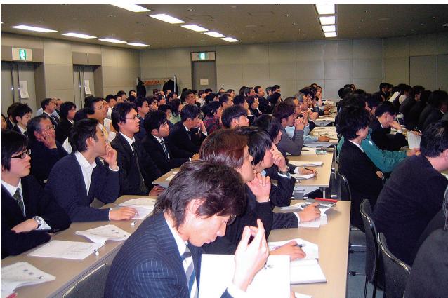
熱心に説明に耳を傾ける受講者

これは広告会社関係の社員も含め、現場作業での安全確認の励行、チェック体制の徹底を行い安全作業及び事故防止に努めていただくための安全講習会で、最近の事故事例を取り上げ安全への認識を深めていた。