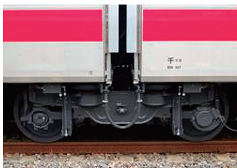
【E331系】に採用された連接台車

を記念して期間限定のA Dトレインが販売される。詳しくはメディアガイドンスかJ企交媒局車両メディア部までお問い合わせください。