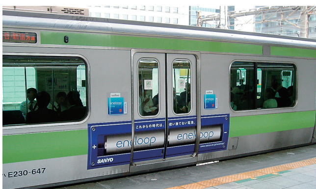
三洋電機充電電池「eneloop」 広告主：三洋電機(株)