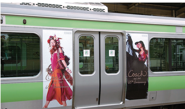
コーチ・ジャパン 65th anniversary 広告主：コーチ・ジャパン(株)