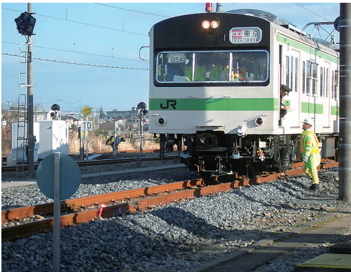
実車で訓練を体験

現地での訓練は実践現場点呼からはじまり、実際に電車を走らせての列車防護、広告事故を想定し、発炎筒を使って電車を緊急停止させるなど本番さながらの実車訓練を体験し、安全確保に必要な知識を学んだ。