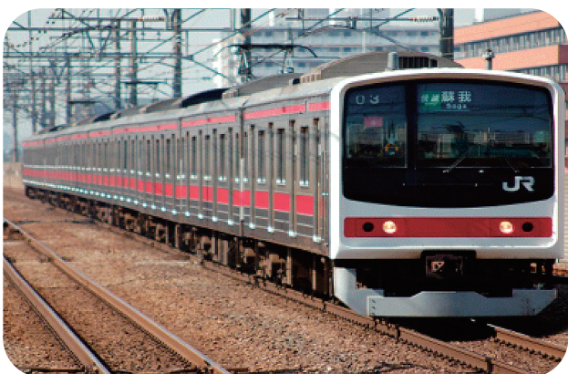
現在使用されている【205系】

京葉線で新型車両 E331系営業運転開始！ 次世代の通勤電車を目指して開発された新型車両E331系が、3月18日(日)のダイヤ改正から京葉線東京・蘇我間で営業運転が開始された。 E331系はステンレス製で、1編成14両、連節構造を取り入れて台車数を減らし乗り心地の向上を図っているほか、床面高さもE233系と同じでホームとの段差を縮める等バリアフリー対策も採用されている。 京葉線で現在使用されている205系、201系と乗車位置が異なるため、当面は土曜日・休日のみの運転となる。 京葉線E331系営業運転開始